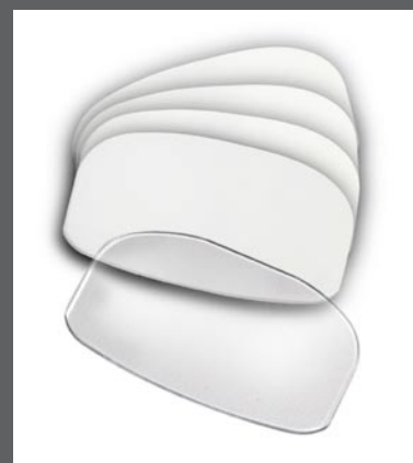
Divers • 11-0318 Kit de 5 vitres de remplacement