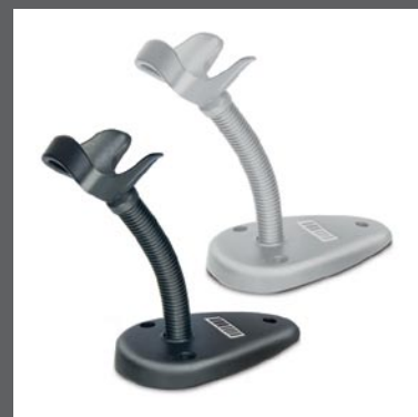
Fixations/Stands • STD-QD20-BK Stand articulé 'Gooseneck', Noir • STD-QD20-WH Stand articulé 'Gooseneck', Blanc